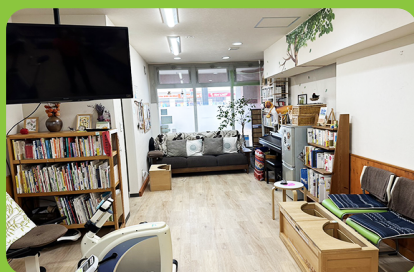
くつろぎスペースには本や足岩盤浴、介護福祉士による日常生活相談もあります。

対象者・介護認定を受けている方 (要支援・要介護・事業対象者) ・一般(自費での利用可)