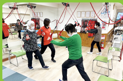
一人ひとりの体の状況に合わせた様々な機能訓練を行います。